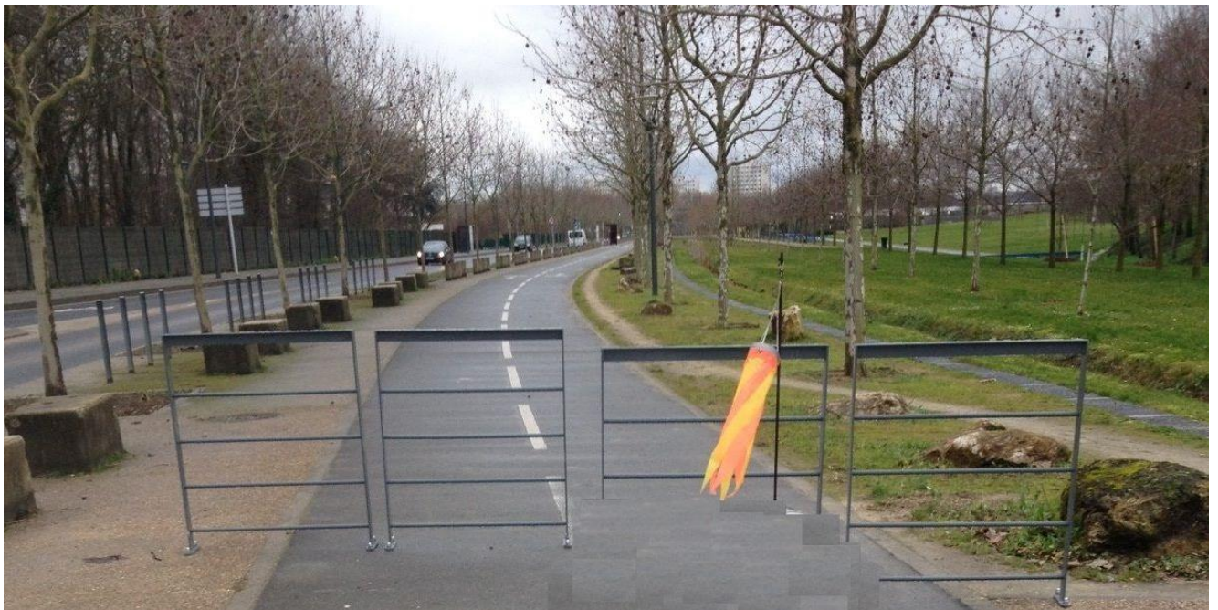
Tégéval. Plage bleue, Valenton, janvier 2016

Objets : Demande de suppression des nouvelles chicanes totales, et peu contrastées, sur la Tégéval (Parc de la Plage Bleue, Valenton)