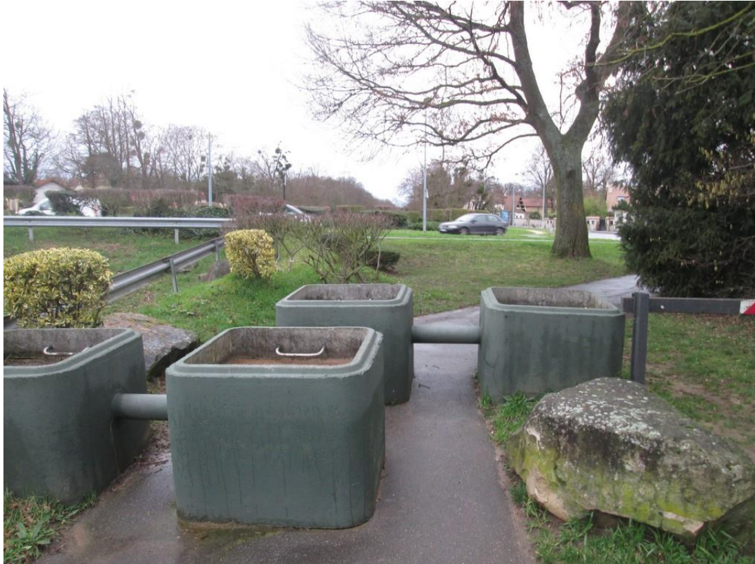
Coulée verte Villecresnes Janvier 2016

Nous pensons également que les chicanes déjà anciennement présentes sur la Coulée verte à Villecresnes (future Tégéval), présentent les mêmes travers :