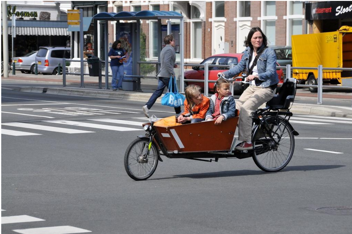
Bipporteur pour le transport quotidien d'enfants