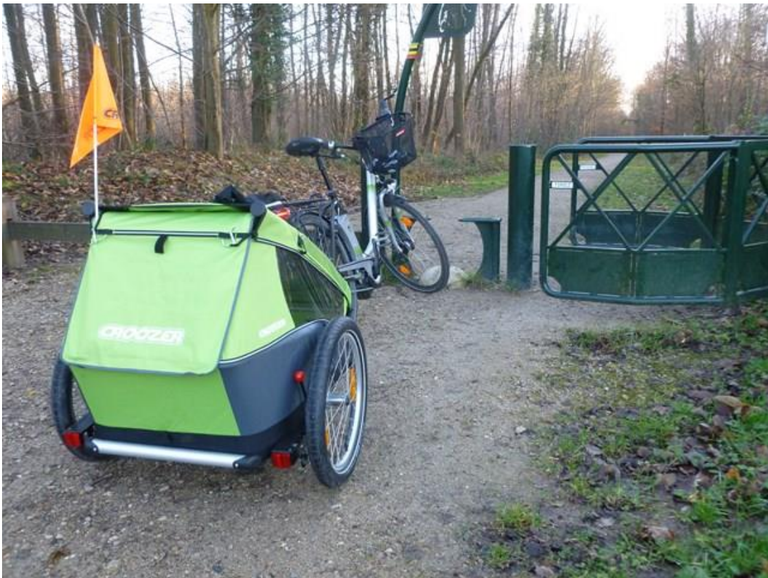
Exemple de convoi familial interdit de voie verte au quotidien (Bords du Réveillon, commune de Yerres), et donc famille renvoyée sur la chaussée, alors qu'une voie verte existe (!)