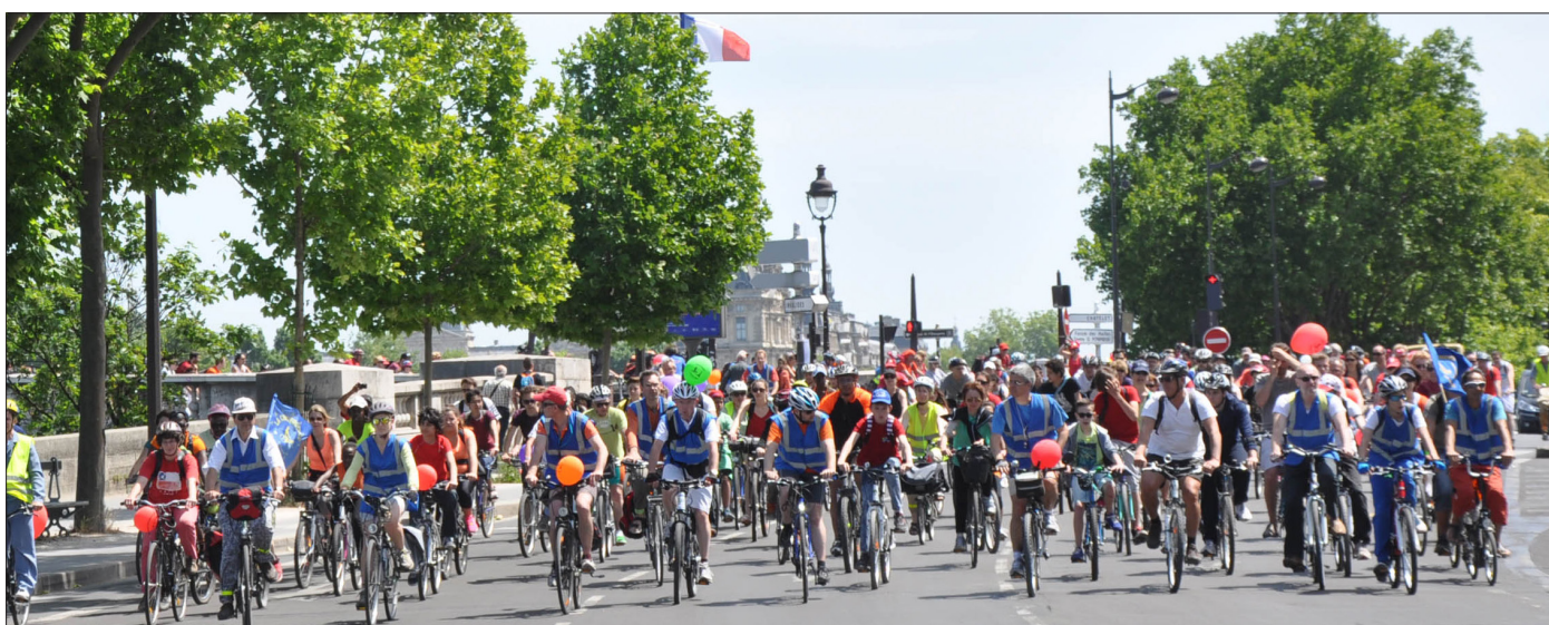
Convergence francilienne 2015 @ Dynamo Malakoff

Cette balade colorée est organisée depuis 10 ans par l'association francilienne Mieux se Déplacer à Bicyclette (MDB) en partenariat avec les associations travaillant à la promotion du vélo urbain en Île-de-France, la Ville de Paris, la Région Île-de-France et une centaine de communes franciliennes.