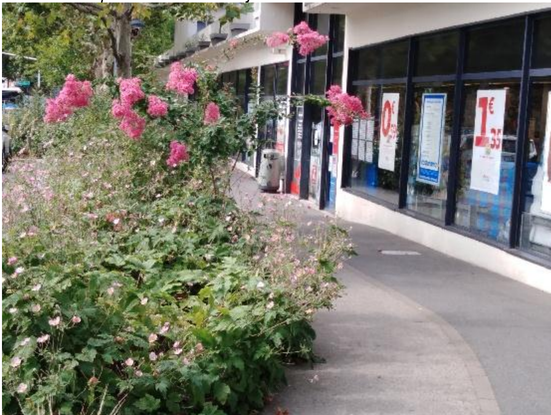
2 : Devant la superette Auchan