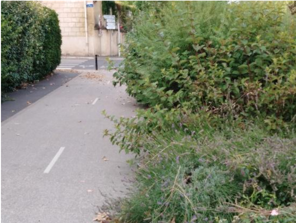
3 : La piste au niveau de la station-service.