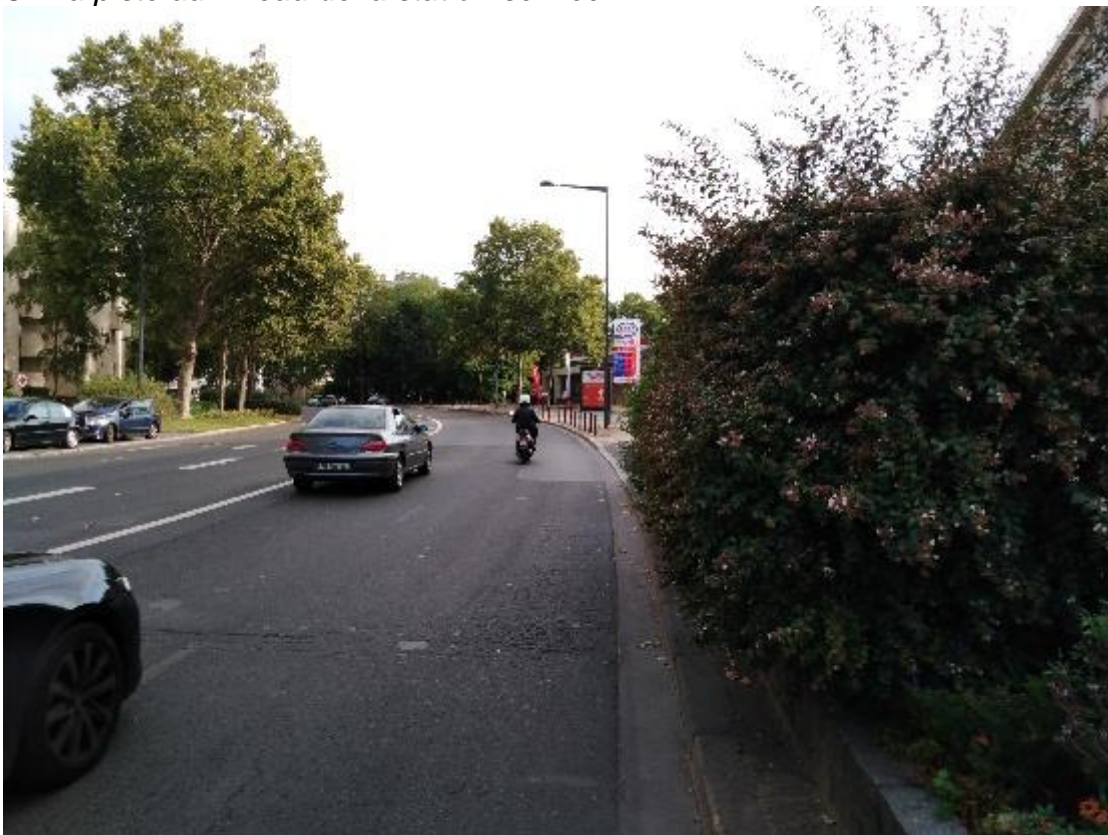
4 : La piste, invisible, se situe juste derrière le buisson ; l'accès à la station-service juste après.