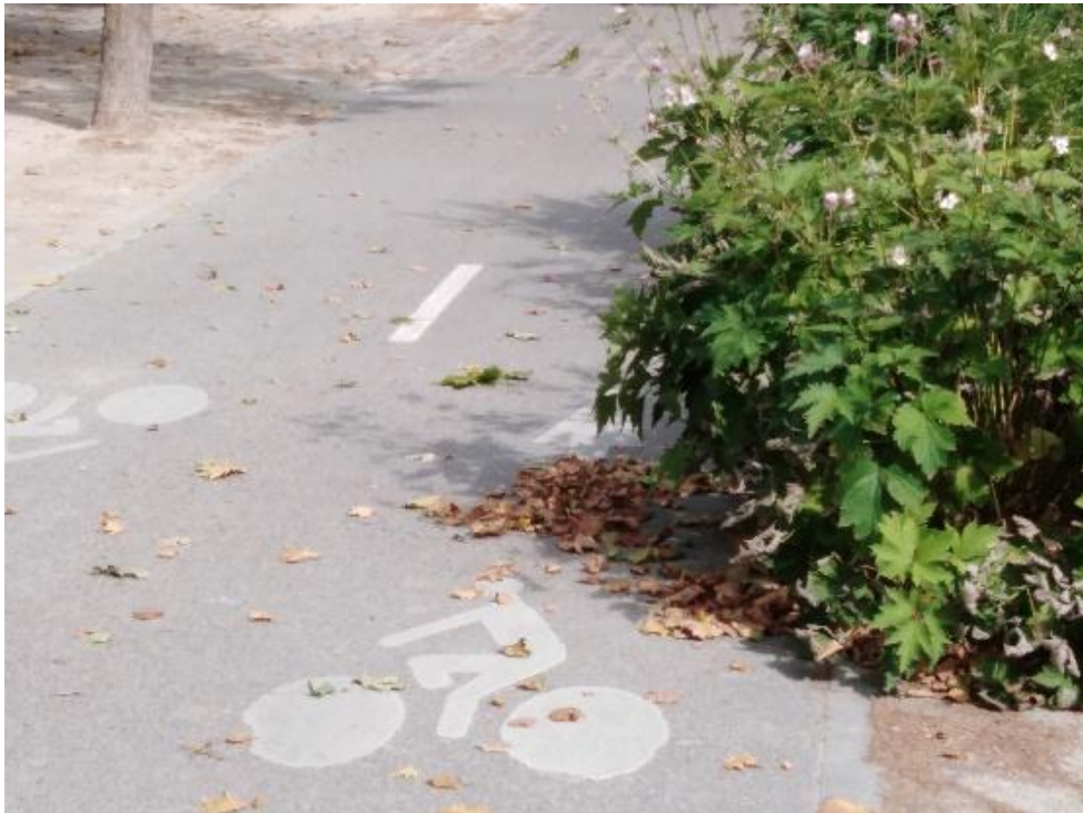
1 : Entre la supérette Auchan et la jonction avec l'Avenue du Général de Gaulle